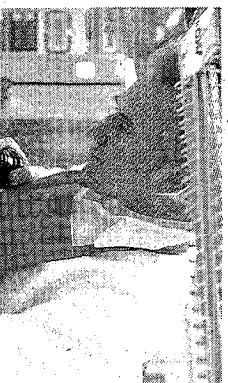
Le chef Cyril Molard, de Ma Langue sourit, a intégré les RestoDays.

LUXEMBOURG - Après le succès de la première édition en Belgique, les RestoDays débarquent au Grand-Duché. À partir de demain, les amateurs de gastronomie pourront profiter de menus le midi et le soir à des prix abordables. De nombreux chefs étoilés s'associent à cette initiative et proposent des menus aux saveurs gastronomiques pour moins de 50 euros. En tout, vingt-sept restaurants du Grand-Duché figurent au menu 2010 de cette semaine des RestoDays.